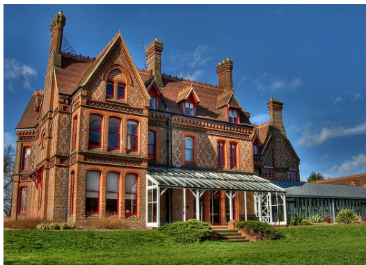
Foxhill House (School of Law)

Reading (ausgesprochen etwa wie „Redding“) ist eine mittelgroße Stadt in der Englischen Grafschaft Berkshire, nicht weit westlich von London.