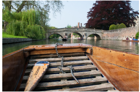
„Punting“ in Cambridge

Bath : Tolle Stadt, sicher einen Ausflug wert. Beste scones (idealerweise als Teils eines Cream Teas genossen) Englands in der winzigen Bäckerei direkt im Brückengebäude.